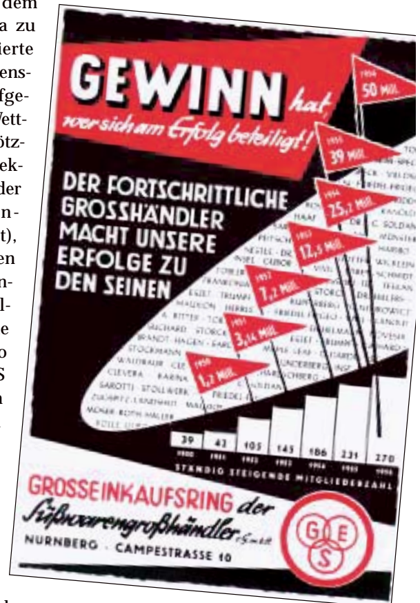
Aus dem Geschäftsbericht 1956

Von 1970 – 1980 schieden mehr als 500 Genossenschaftsmitglieder – fast ausschließlich wegen Firmenaufgabe, meist aus Altersgründen – aus der GES aus, Übertragungen von Geschäftsanteilen nicht mitge-